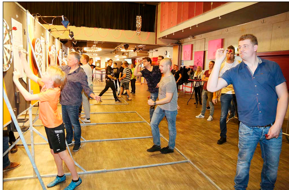
Geconcentreerd worden de pijltjes door de darters geworpen.

Er hadden zich vijftig darters opgegeven