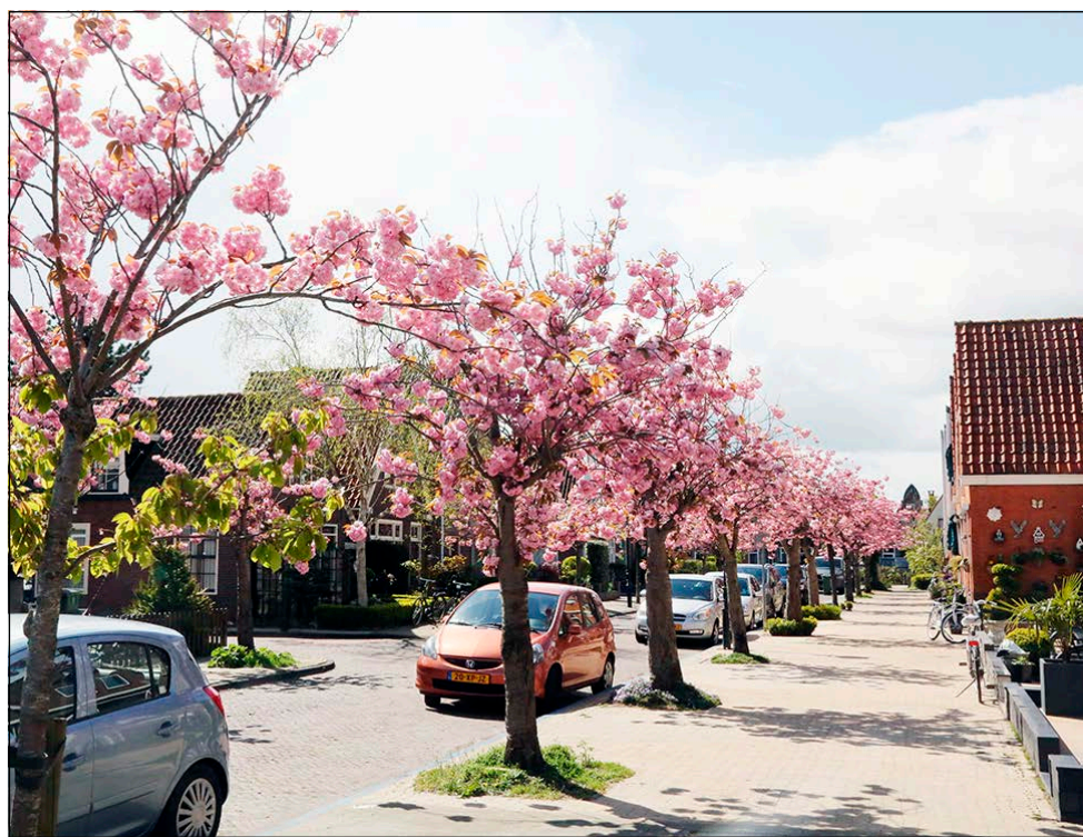
Een fraai doorkijkje in de Zwaardstraat waar de bloesems volop in bloei staan.