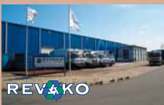
HOEK VAN HOLLAND