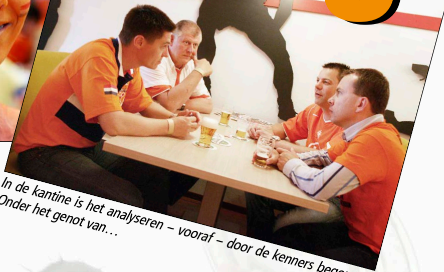
In de kantine is het analyseren – vooraf – door de kenners begonnen. Onder het genot van...