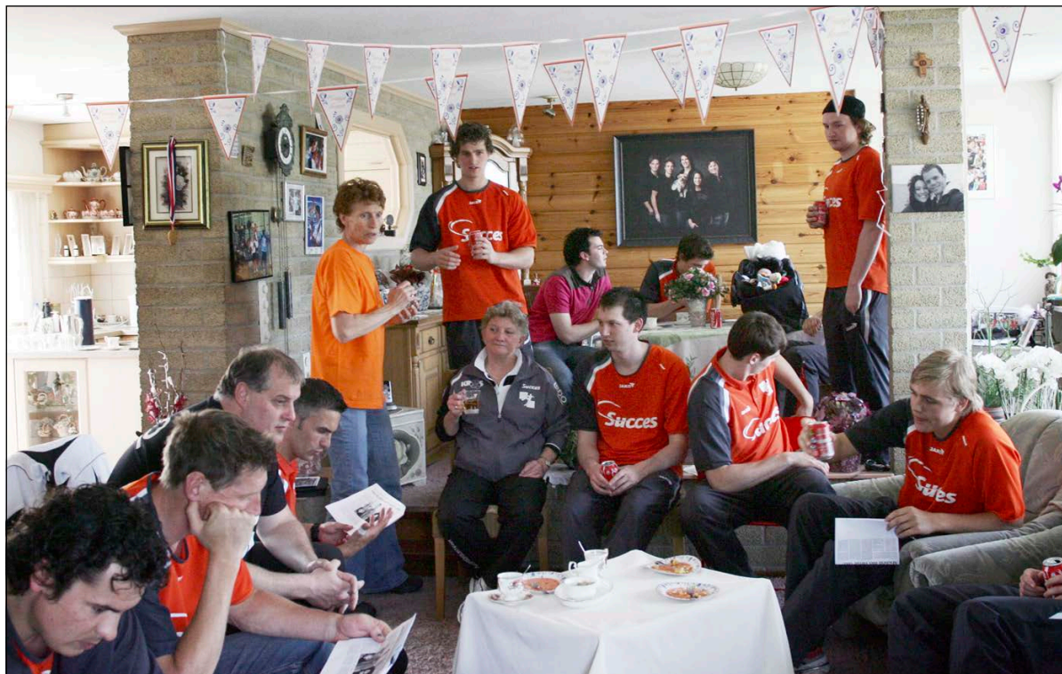
De huiskamer als verzamelpunt. Voorbeschouwingen uit de kranten worden gelezen.