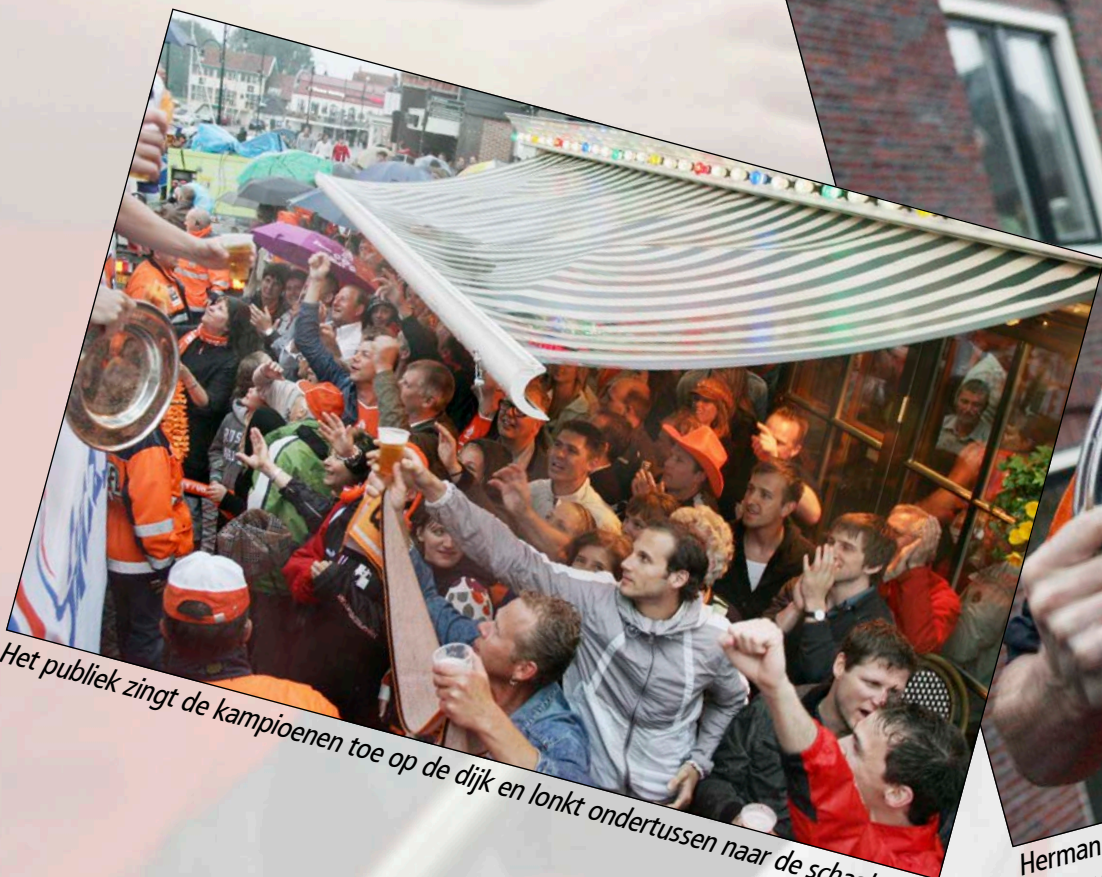
Het publiek zingt de kampioenen toe op de dijk en lonkt ondertussen naar de schaal.