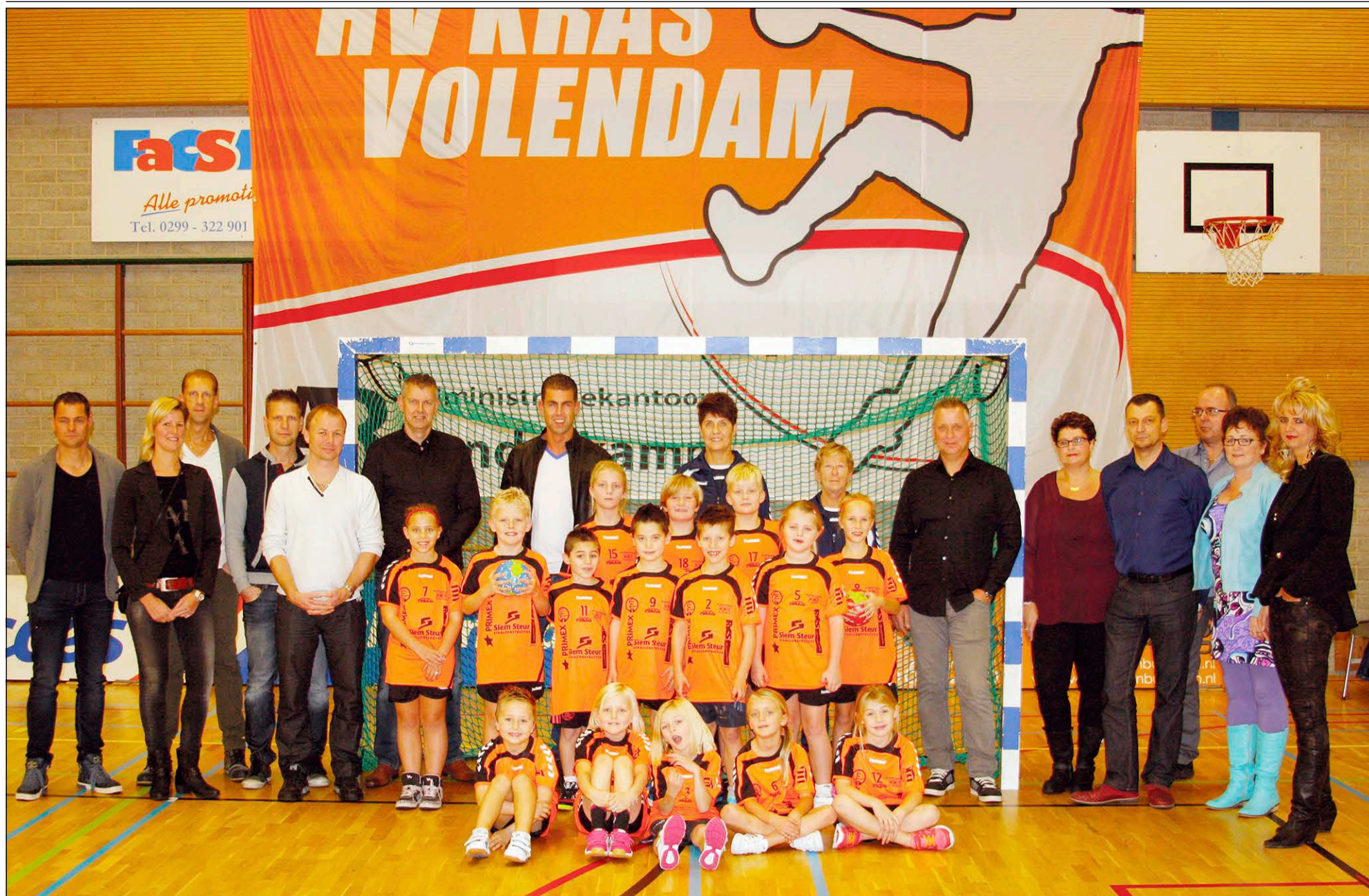
De F-Jeugd van Kras/Volendam.