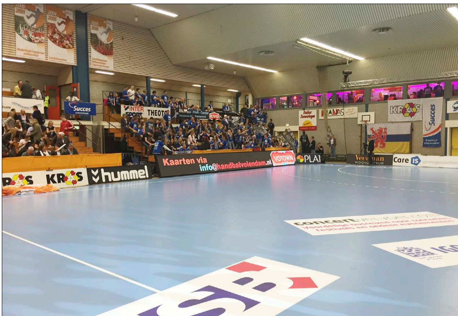
De LED-boardings in sporthal Opperdam.