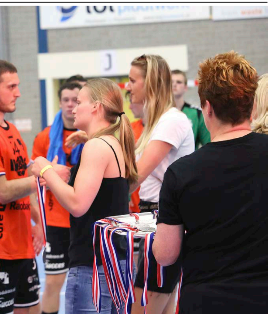
medaille van de nummer twee omgehangen heeft gekregen (van onder meer de

„Nu overheerst de teleurstelling. Ik had mijn carrière natuurlijk graag met een wedstrijd verlengd en dan in een derde wedstrijd proberen af te sluiten met een landstitel. Maar morgen (maandag, red.) zullen we ook wel trots voelen, dat we dit allemaal hebben bereikt.”